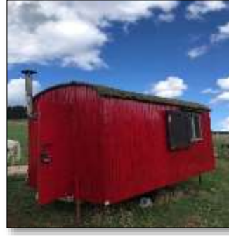
Unser „Neuer“ Bauwagen

„Jedes Werden in der Natur, im Menschen, in der Liebe muss abwarten, geduldig sein, bis seine Zeit zum Blühen kommt.“ -Dietrich Bonhoeffer-