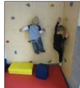
Bewegung, Körper, Gesundheit, Sprache, Kommunikation, Soziale Bildung, Mathematische Bildung

Ein sehr abwechslungsreiches Außengelände mit seinen verschiedenen Sträuchern, Obstbäumen und einem Nutzgarten, bietet den Kindern eine Vielzahl von Möglichkeiten an, mit den Elementen der Natur in Kontakt zu treten.