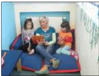
Lesen: Sprache, Soziale Bildung, Medien

Hierzu wieder ein paar Fotos unter denen jeweils die vorrangigen Bildungsbereiche aufgeführt sind: