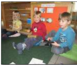
Musische Bildung, Sprache

Am Nachmittag finden weitere Angebote statt, zum Beispiel: Turnen, Kleingruppenangebote, die sich an den Bedürfnissen der Kinder orientieren.