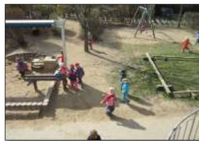
Ökologische Bildung, Bewegung, Gesundheit, Sprache, Kommunikation