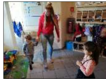
Besuch in der zukünftigen Gruppe

Schon rechtzeitig leiten wir den Übergang und somit den Beziehungsaufbau der U3 Kinder in ihre zukünftige Regelgruppe ein. Dies geschieht z.B. durch Besuche in der neuen Gruppe und durch Übergabegespräche mit Eltern und Erziehern der jeweiligen Gruppe.