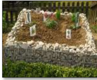
Gartenpflege: Ökologische Bildung, Naturwissenschaft