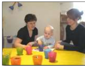
Eingewöhnungszeit mit Eltern