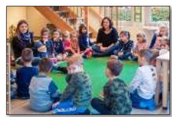
Sitzkreis: Bewegung, Musische Bildung, Religion, Ethik