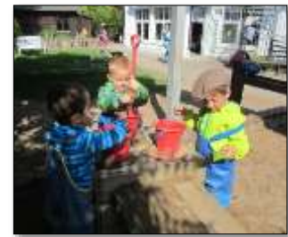
Bewegung, Körper, Gesundheit, Sprache, Kommunikation, soziale, mathematische, ökologische, naturwissenschaftliche, ästhetische Bildung,