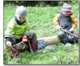
Schnitzen: Bewegung, Gesundheit, ästhetische Bildung,