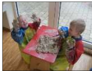
Knettisch: Feinmotorik, Sensomotorik, Gesundheit