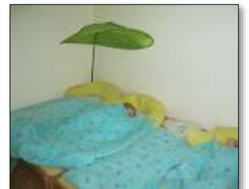
Körper, Gesundheit, Religion und Ethik, Sprache, Kommunikation, soziale, kulturelle, interkulturelle und ästhetische Bildung