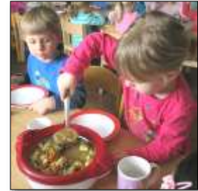
Körper, Gesundheit, Religion und Ethik, Sprache, Kommunikation, soziale, kulturelle, interkulturelle und ästhetische Bildung