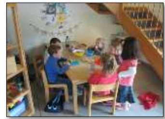
Körper, Gesundheit, Ernährung, Kommunikation, Soziale u. Kulturelle Bildung

In den ersten Jahren eines Kindes ist der Umgang mit Essen sehr bedeutsam für das weitere Ernährungsverhalten im Leben. Die Grundsteine für eine gesunde Ernährung sowie eines verantwortungsbewussten Umgangs mit seiner Gesundheit werden in der Kindheit gelegt. Eine gesundheitsbewusste Verpflegung nimmt großen Einfluss auf körperliche und geistige Entwicklung der Kinder. Darüber hinaus fördert das gemeinsame Essen und Trinken die Gemeinschaft und das soziale Miteinander.