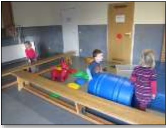
Psychomotorik: Bewegung, Gesundheit, Soziale K.

Gartenpflege, Werken und Schnitzen, Dinosaurier, Weltall, Theaterspielen mit Kindern ab 2, Geschichtensäckchen, Kochen, Sprachschatzerweiterung.