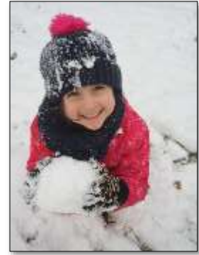
Bewegung, Körper, Gesundheit, Kommunikation, soziale, mathematische, ökologische Naturwissenschaftlich-technische Bildung

Einmal jährlich findet für die Regelgruppen (3-6-jährigen) eine Waldwoche statt. Die U-3 Kinder genießen und erkunden in dieser Zeit unser gesamtes Außengelände und einen Tag verbringen sie auf einem nahegelegenen Bauernhof.